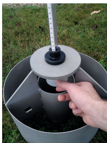
Infiltromètre à charge constante