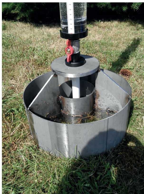
Infiltromètre à charge variable

* Entretoise servant à caler l'infiltromètre une fois l'appareil enfoncé dans 5 cm de sol