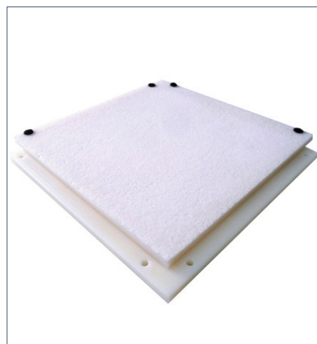
Plaque d'échantillonnage en plastique poreux