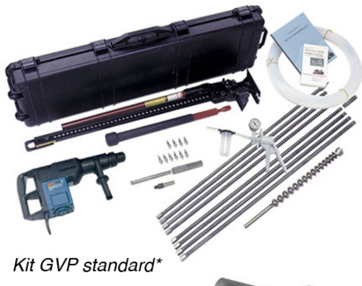
Kit GVP standard*

Le système de prélèvement de gaz du sol GVP permet l'accès rapide à de multiples points d'échantillonnage grâce à sa pointe de prélèvement direct Retract-A-Tip , ainsi que la mise en place de points de mesure réutilisables grâce à ses pointes dédiées, dans la plupart des sols jusqu'à 4m de profondeur. Ce kit est disponible en diverses configurations, avec pointes perdues et/ou pointe récupérable Retract-a-Tip , en version manuelle ou motorisée.