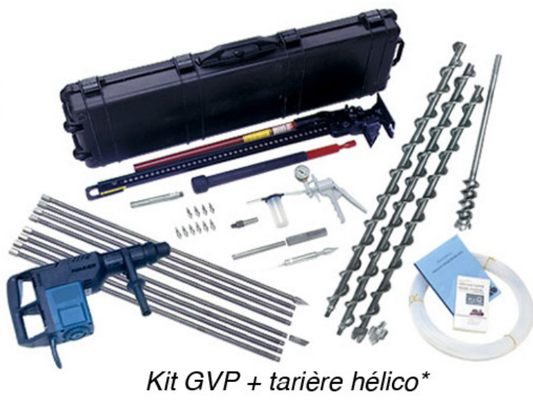
Kit GVP + tarière hélico*