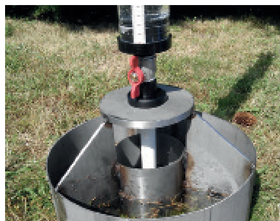
INFILTROMÈTRE À CHARGE VARIABLE

TRIANGLE DE TEXTURES (D'APRÈS CRDP.AC-AMIENS)