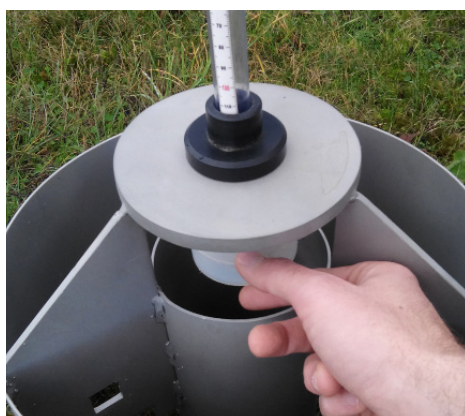
INFILTROMÈTRE À CHARGE CONSTANTE